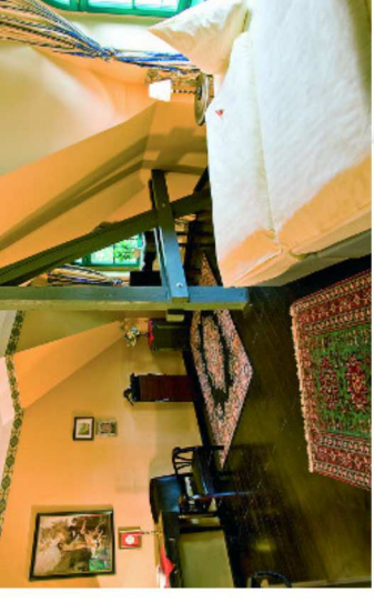
Bildtext: Blick in ein Gästezimmer vom Gasthaus und Hotel Zur Henne in Naumburg.

den Gebäuden einer ehemaligen Brauerei. Neben liebevoll eingerichteten Doppel- und Dreibettzimmern befinden sich im Haus auch Apartments und Ferienwohnungen.