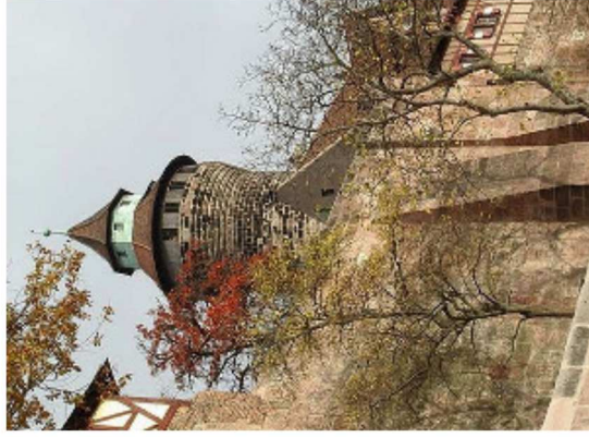
Sinwillturm in Nürnberg.

Auch hier handelt es sich um ein ausgefeiltes kulturpädagogisches Konzept, diesmal in die Frankен-Metropole Nürnberg. Kinder, aber auch Erwachsene, erfahren bei dieser Reise spielerisch, wie sich das Leben auf einer Burg abspielte. Wie lebte und feierte man auf einer Burg? Wie war die Burg gesichert? Wie veränderten sich Rüstungen und Scherwerter im Laufe der Zeit und wie schwer ist ein Kettenhemd, wenn man es trägt? Auf diese und andere Fragen gibt es umfassende, erlebnisreiche Antworten.